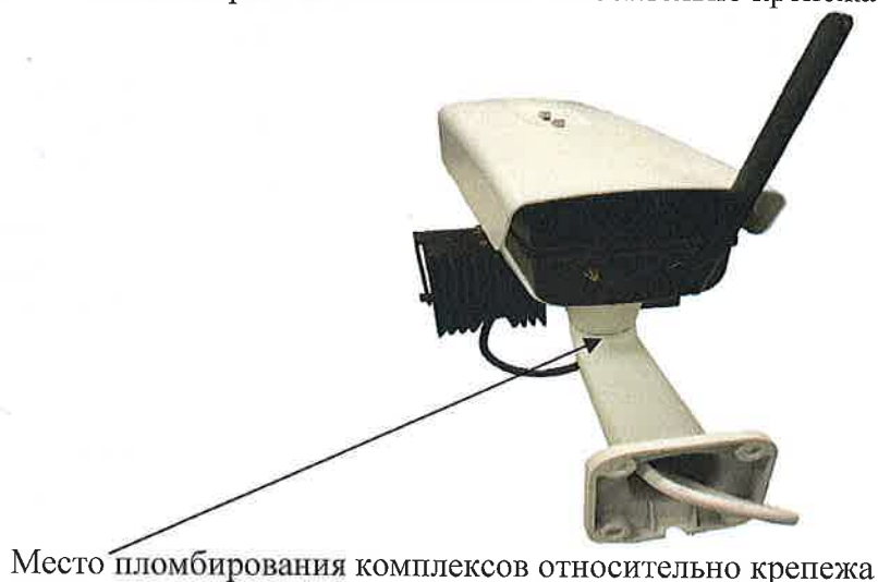
Рисунок 3 – Схема пломбирования комплексов относительно крепежа

Схема пломбирования комплексов относительно крепежа представлена на рисунке 3.