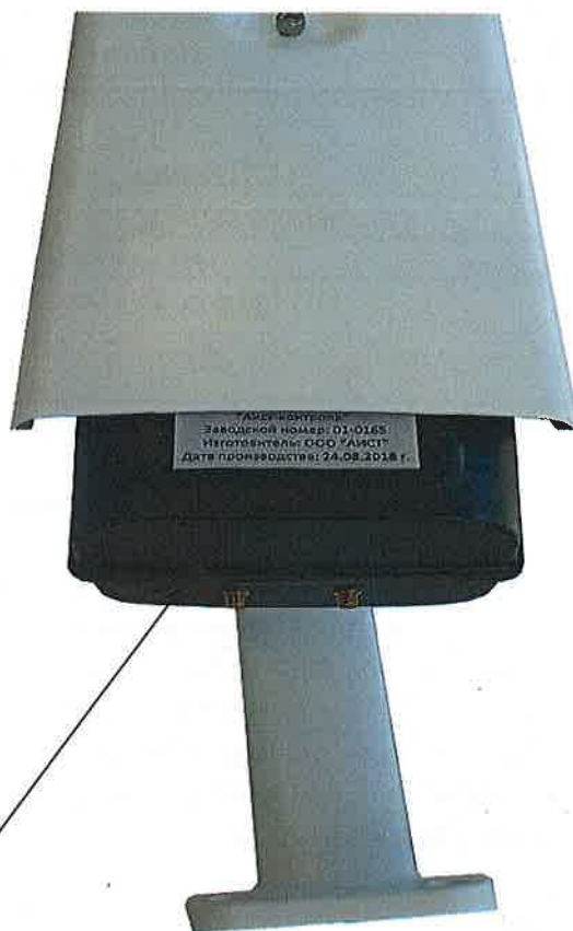
Схема пломбировки от несанкционированного доступа и маркировки комплексов представлена на рисунке 2.

Место пломбировки от несанкционированного доступа